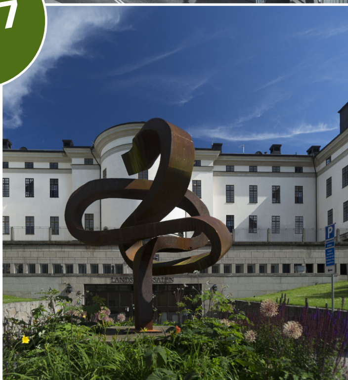
Danish Sarcos