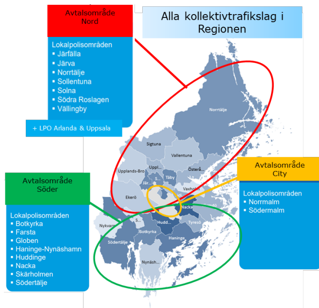
Figur 3 Avtalsområde med samverkansfokus för ordningsvaktstjänster

För att ytterligare förstärka kraven hos leverantörer gällande den lokala kännedomen så inarbetas krav på samverkansförmågor i kommande trygghetsavtal samt trafikavtal.