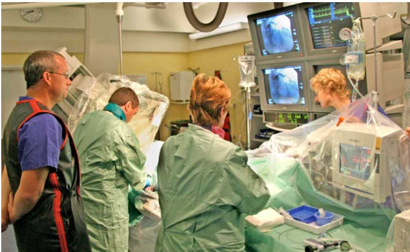
...till en operation i Sverige.