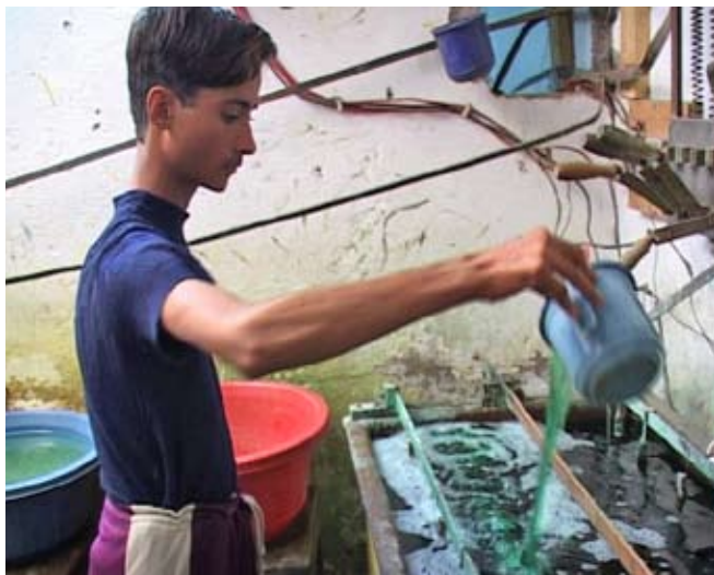
Tillverkning av kirurgiska instrument i Pakistan...