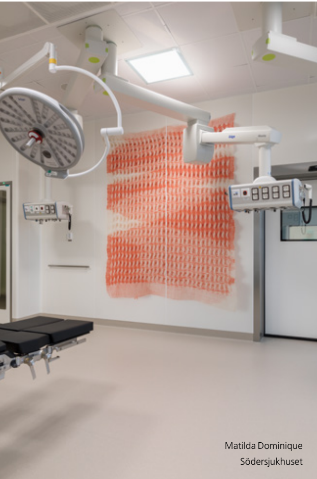
Matilda Dominique Södersjukhuset