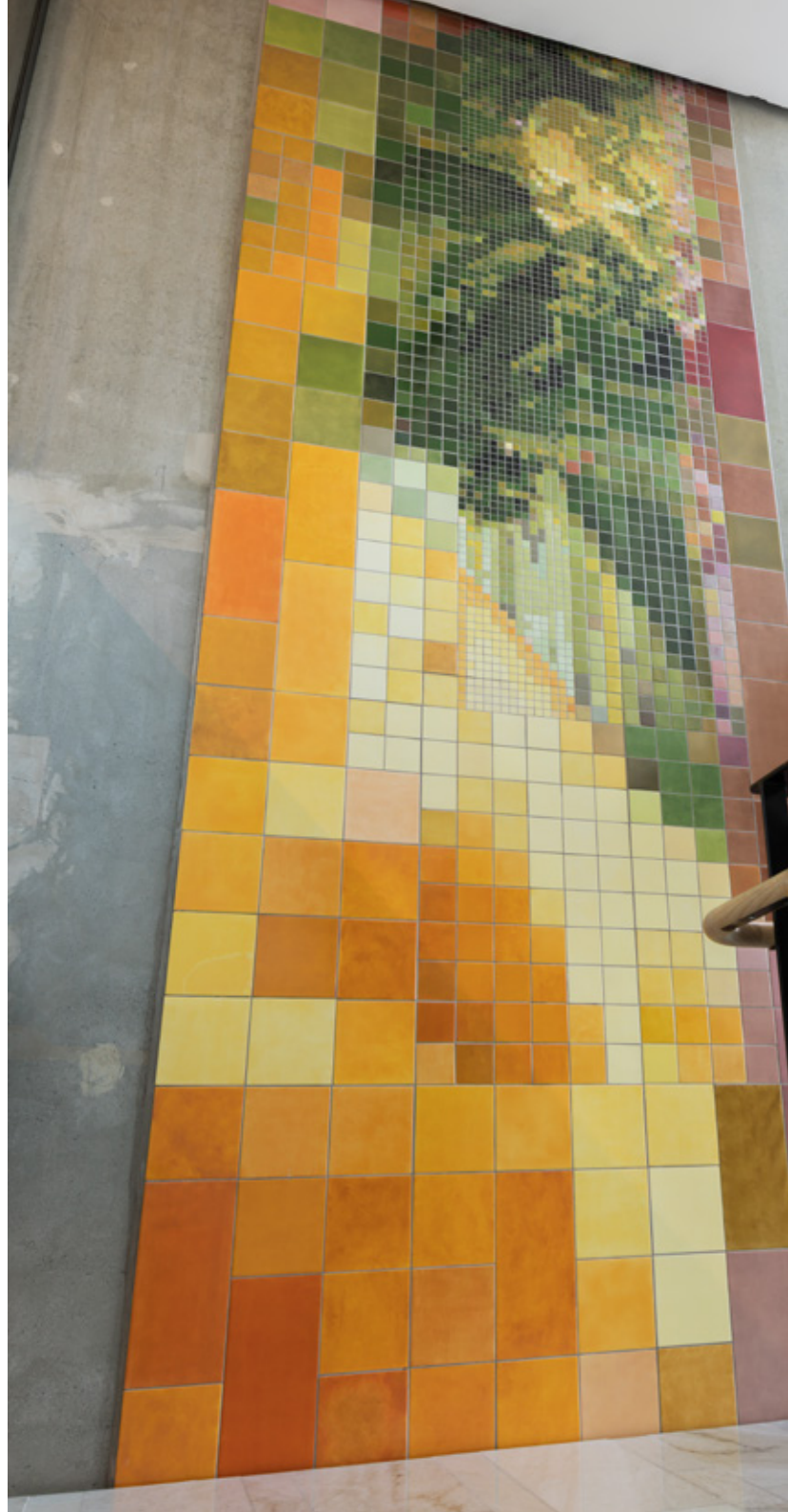
Sub rosa Tuula Lehtinen Danderyds sjukhus