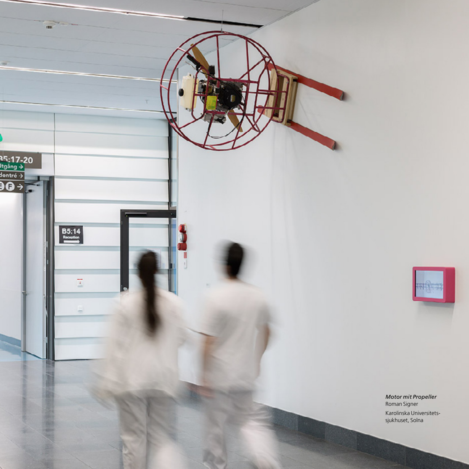
Motor mit Propeller Roman Signer Karolinska Universitets- sjukhuset, Solna